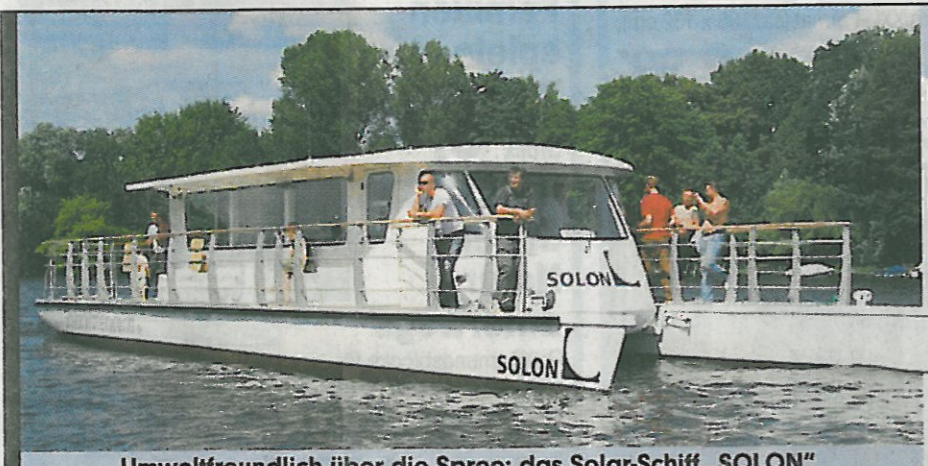
Umweltfreundlich über die Spree: das Solar-Schiff „SOLON“